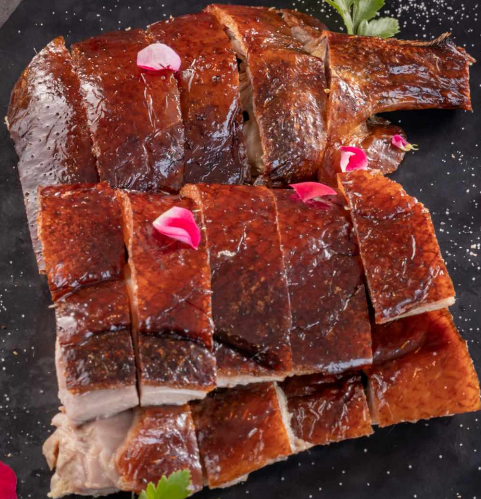
VỊT QUAY HONG KÔNG (1 suất) Hong Kong Roasted Duck (pax)